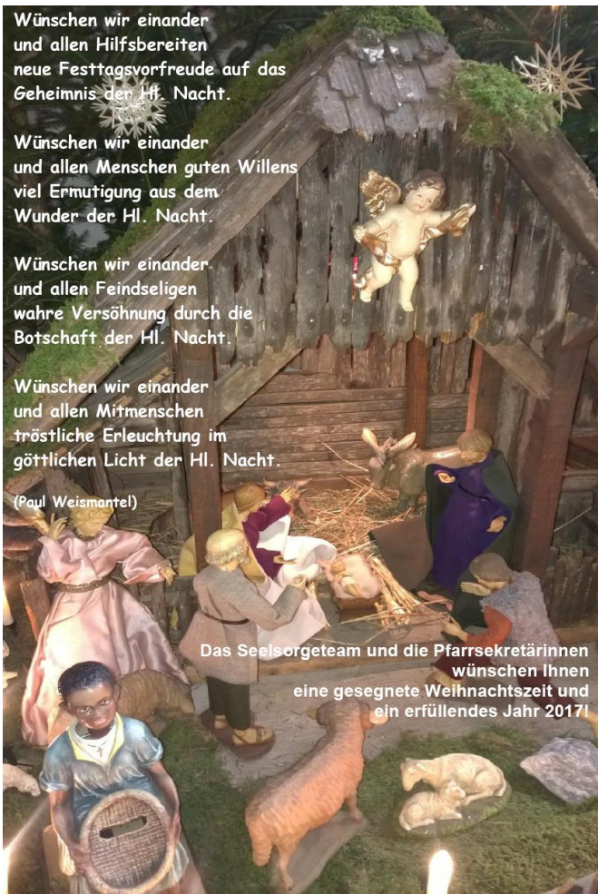
Das Seelsorgeteam und die Pfarrsekretärinnen wünschen Ihnen eine gesegnete Weihnachtszeit und ein erfüllendes Jahr 2017!