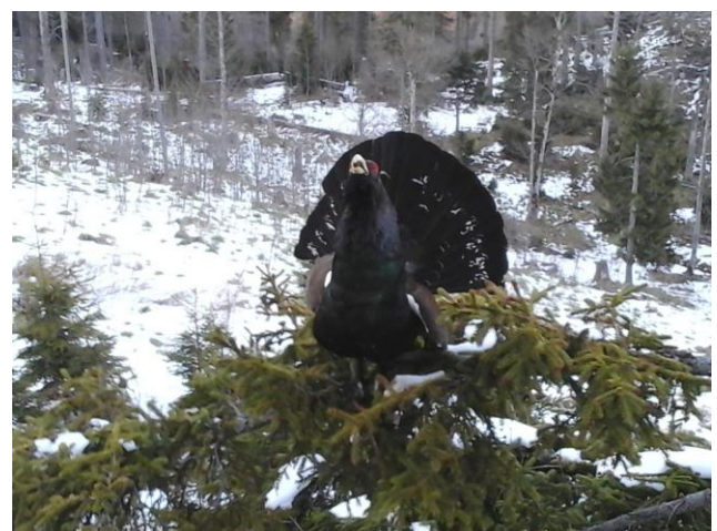
Bild: Auerhahn ein Überlebenskünstler stößt an seine Grenzen. Seine Strategien funktionieren bei vielen Menschen nicht mehr. Er verbraucht zu viel Energie und verhungert.